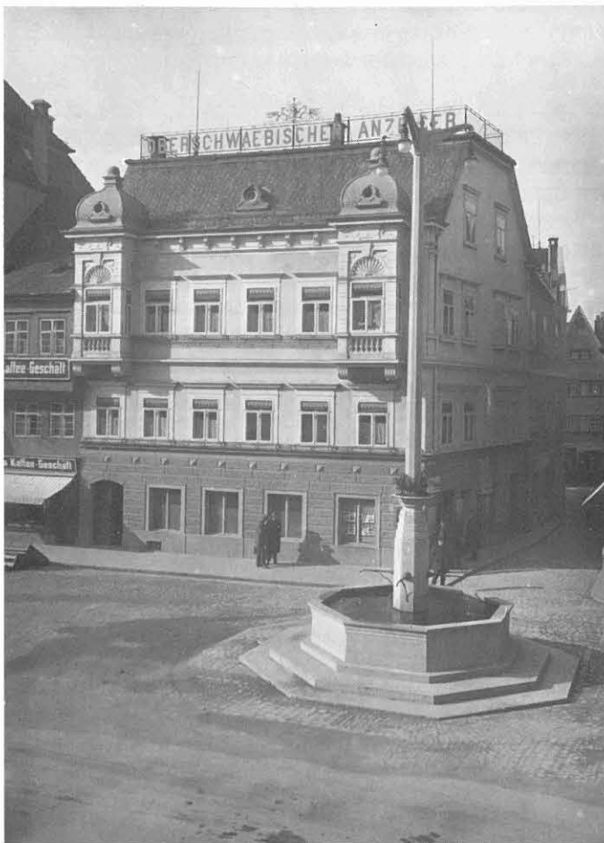
Die „Schwäbische Zeitung“ auf dem Marienplatz nach dem Umbau von 1893. Aufnahme um 1910.