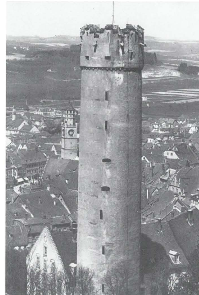
Der Mehlsack, das Wahrzeichen der Stadt Ravensburg, wurde 1425–29 erbaut, wie die Holzaltersbestimmung ergab.

2. Hinter der vielfach, zuletzt im Barockstil veränderten Fassade des Hauses Marktstraße 59, der ehemaligen Zentrale der Ravensburger Handelsgesellschaft, verbirgt sich der Kern eines der ältesten Häuser Süddeutschlands. Der untere Teil mit dem zur Straße gelegenen Raum wurde