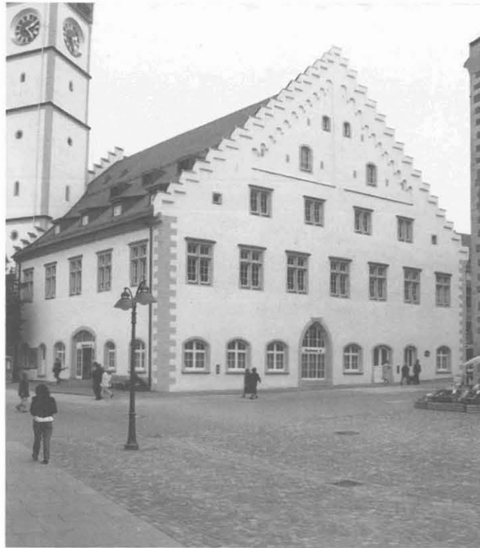
Die Kreissparkasse und die Stadt Ravensburg für das Waaghaus

Alljährlich zeichnet das Bürgerforum Altstadt vorbildlich renovierte Gebäude in der Altstadt aus. 1988 erhielten einen Preis in Form einer Urkunde: