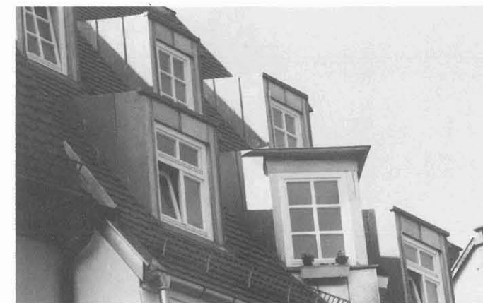
Ein „übermöbliertes“ Dach. Schön?