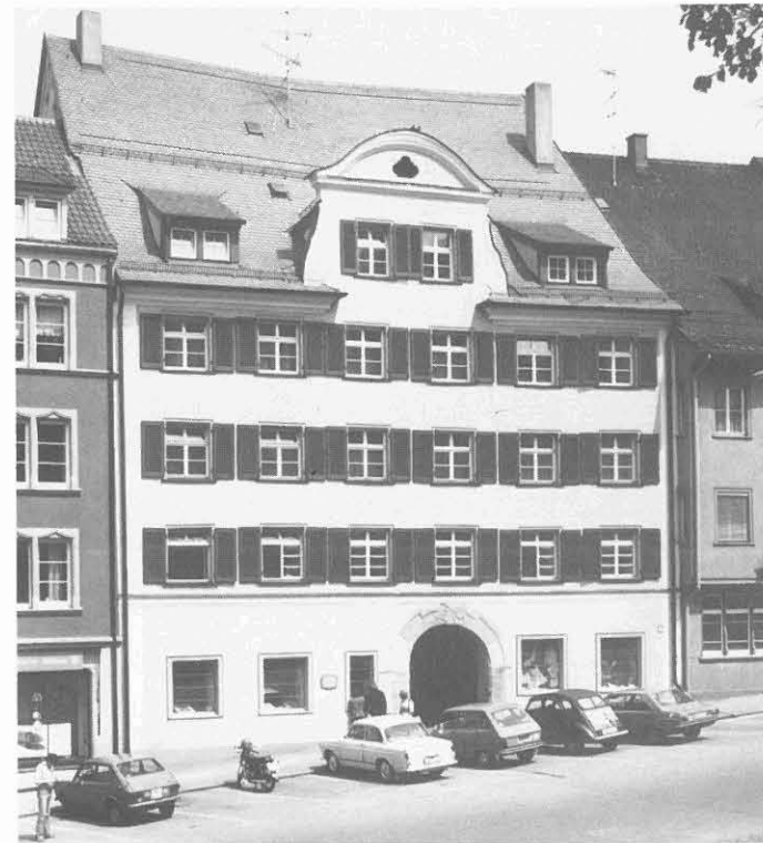
Außen barock, im Kern eines der ältesten Häuser Süddeutschlands: Marktstraße 59, ehemaliger Sitz der Großen Ravensburger Handelsgesellschaft mit Bauteilen aus den Jahren 1179/80.