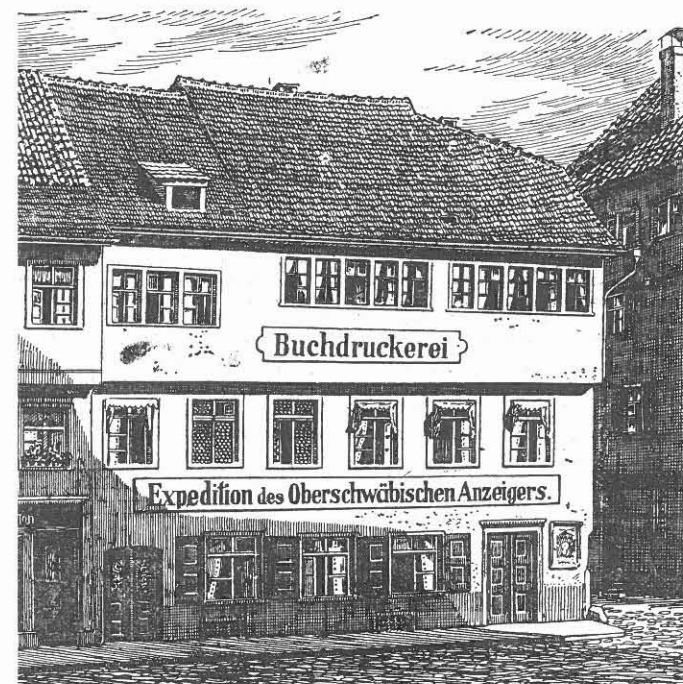
Dasselbe Gebäude um 1880 mit Krüppelwalmdach.