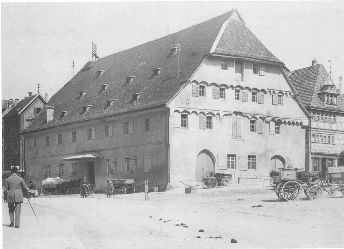
Dendrochronologische Untersuchungen ergaben, daß das Kornhaus 1451/52 errichtet wurde. Der Fachwerkbau erhielt im Jahr 1618 vorgeblendete Steinmauern, um den Eindruck von Monumentalität zu erwecken.