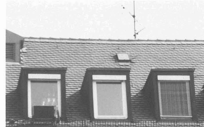
Dachgauben als oft notwendiges Element . . .