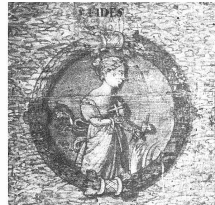
Die ältere Ausmalung derselben Stube geht vermutlich auf Martin Beitler im Jahr 1561 zurück. Dargestellt waren ursprünglich die sieben Tugenden. Hier im Ausschnitt Nr. 5 Fides/Glaube.