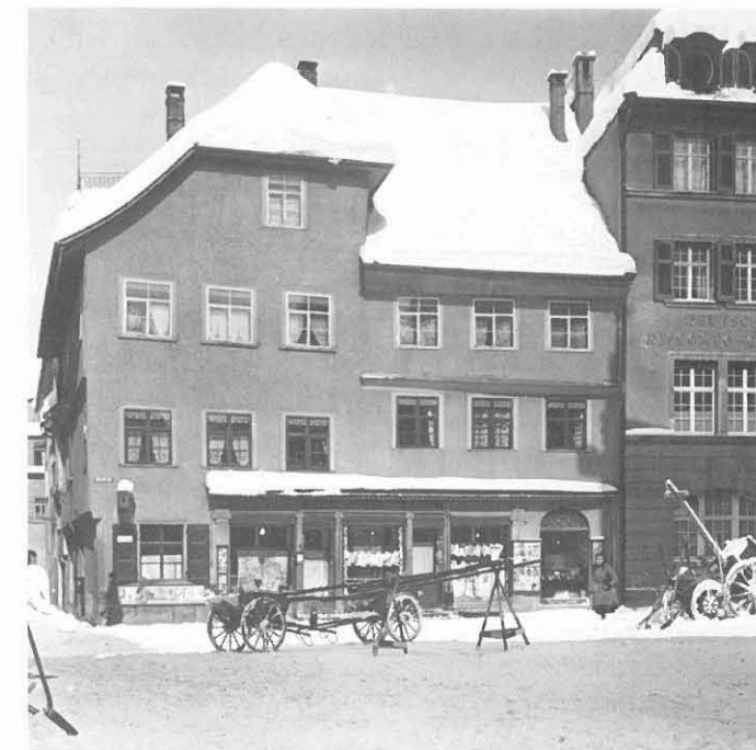
Das Gebäude Bachstraße 2, ehemals „You“, um 1920.

Das Gebäude prägt durch die charakteristische ungleiche Giebelfront den gesamten Straßenzug vis à vis des Seelhauses. Daß es sich dabei ursprünglich einmal um zwei Einzelgebäude gehandelt hat, die irgendwann zu einem Wohnhaus zusammengefaßt wurden, ersieht man nicht nur aus den Archivunterlagen. Vor rund 20 Jahren wurde