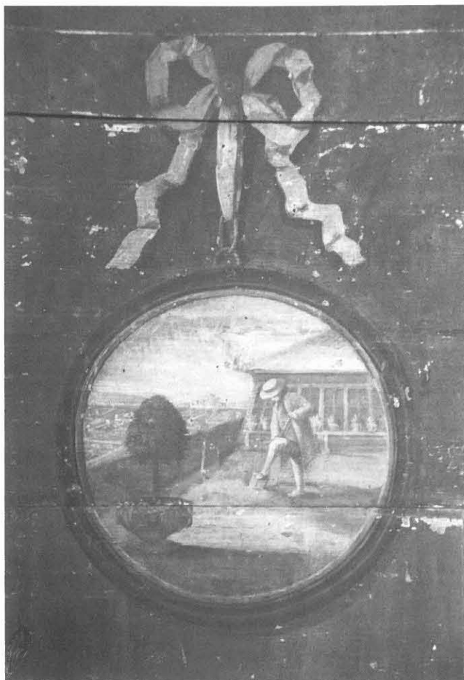
Medaillon mit der Darstellung eines Frühlingsmonats. Wandmalerei von Franz Joseph Fischer aus dem Jahr 1786 in einem Gebäude in der oberen Bachstraße.