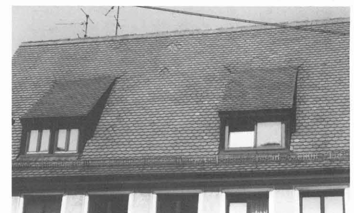
Wie erholend für das Auge wirkt diese klar gegliederte, die Proportionen wahrende Dachlandschaft.