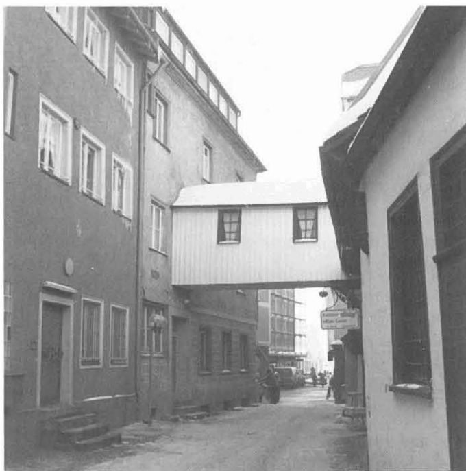
Rund 260 Jahre lang verband das gedeckte Brücklein in der Goldgasse die Wirtschaft zur Krone in der Bachstraße mit der ehemaligen Tanzlaube.