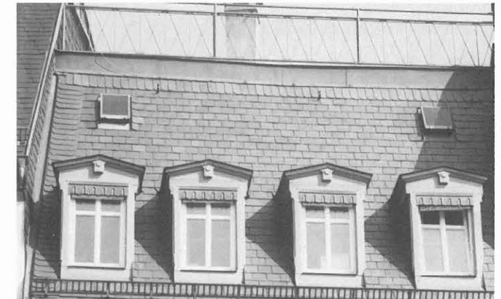
können sich harmonischer in die Dachlandschaft einpassen, wie dieses Beispiel zeigt.