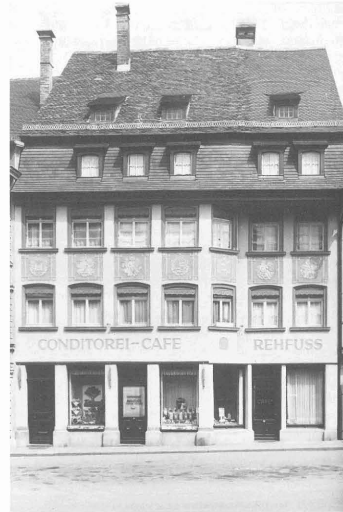
Das ehemalige Café Krumm/Rehfuß, heute Modehaus Reischmann.