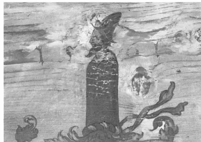
Wappenfragment mit der Datierung 1561. Es handelt sich vermutlich um das Wappen von Martin Beitler.